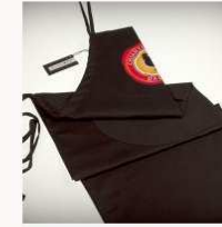
Grembiule con marchio Chianti Classico € 14,00 MORE