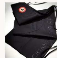
Grembiule Chianti Classico € 17,50 MORE