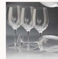
Luigi Bormioli glass € 5,00 MORE