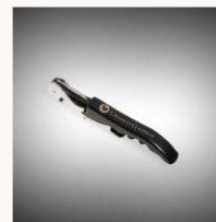
Corkscrew € 6,50 MORE