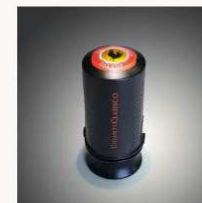
Wine saver € 7,95 MORE