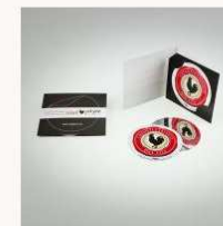
Chianti Classico DropStop € 7,00 MORE