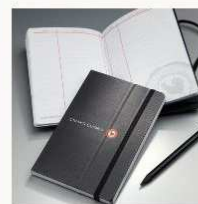
Chianti Classico tasting notebook € 10,00 MORE