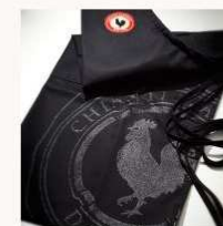
Grembiule Logo € 17,50 MORE